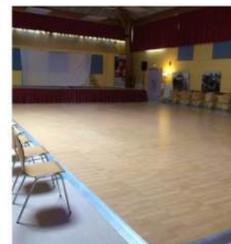
PISTE DE DANSE INTERIEURE