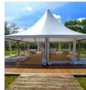
FORMAT 10x10M 100M 2