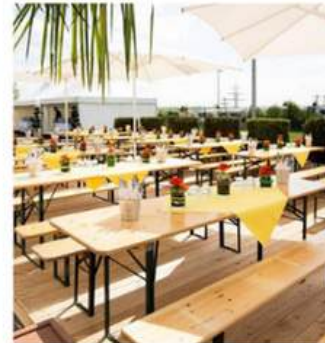
TABLES ET BANCS