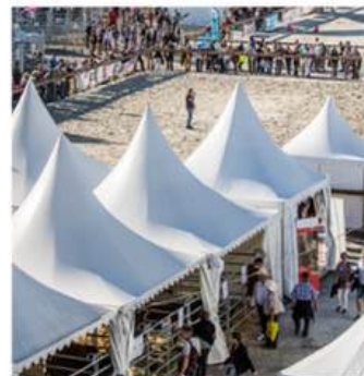
FORMAT 4x4M 16M 2