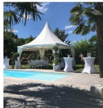
FORMAT 5x5M 25M 2