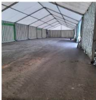
LARGEUR 10M HAUTEUR 3M