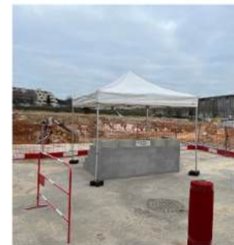
POSE DE 1ERE PIERRE