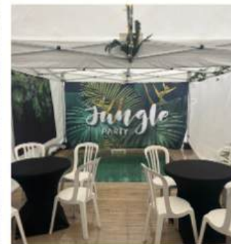
FORMAT 3X3M- 9M2