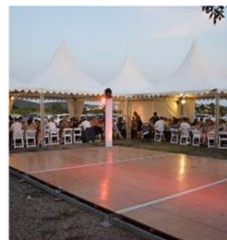
PISTE DE DANSE EXTERIEURE