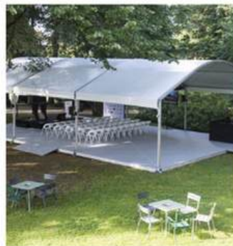
LARGEUR 15M AUVENT ARQUÉ