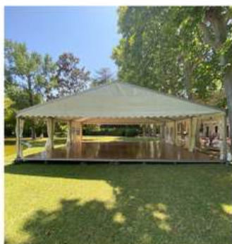
PLANCHER SOUS TENTE