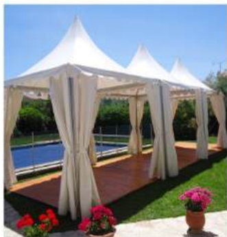
FORMAT 3x3M 9M 2