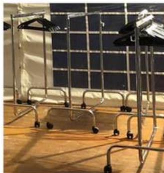
PORTANTS & CINTRES