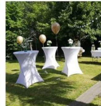
TABLES MANGES DEBOUT