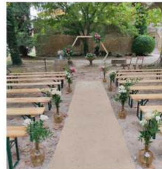
BANCS EN BOIS