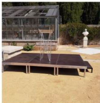
MODULES DE 1Mx2M