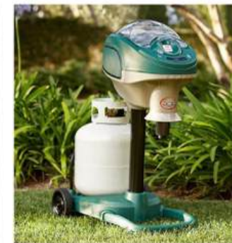
APPAREIL ANTI MOUSTIQUES