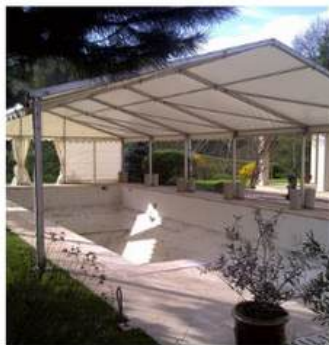
PROTECTION DE TRAVAUX